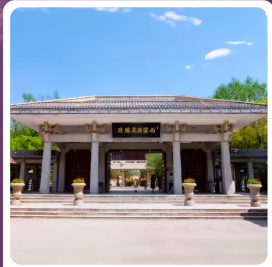
อุทยานประวัติศาสตร์จี้จวงวน