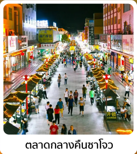
ตลาดกลางคินซาโจว