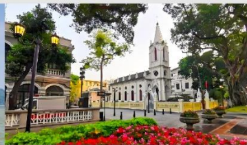
เกาะชาเมี่ยน