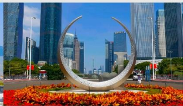
จัตุรัสฮั่วเจิง

*ทางบริษัทฯ ขอสงวนสิทธิ์ในการสลับโปรแกรมทัวร์ตามความเหมาะสมขึ้นอยู่กับสถานการณ์ทำงาน โดยคำนึงถึงผลประโยชน์ของลูกค้าเป็นสำคัญ