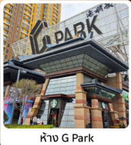
ห้าง G Park