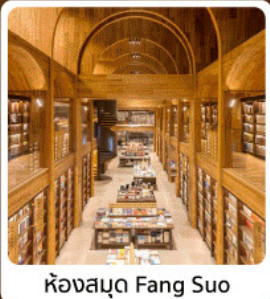
ห้องสมุด Fang Suo