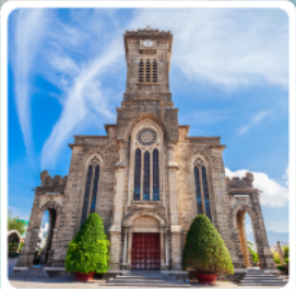
โบสถ์หินญาจาง