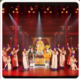
The Heritage Show