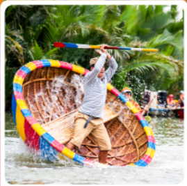
เรือกระด้าง