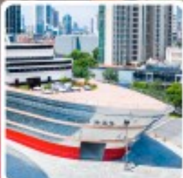
เรือหลุย

• ไอโกลี...เที่ยวมหานครเซี่ยงไฮ้ ชมความสวยงามหาดไว่ทาน และ NORTH BUND ซ้อมปีงถนนนานกิง