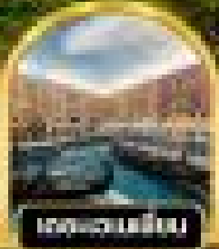
ชมเมืองจีน