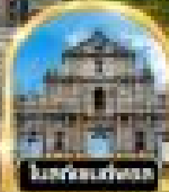
ไหว้พระขอพร