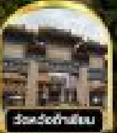
ชมเมืองฮาร์วี่