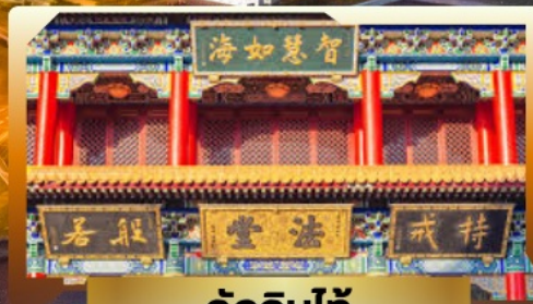
วัดจินไท่