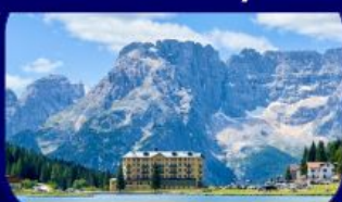
อุทยานฯ โดโลไมท์