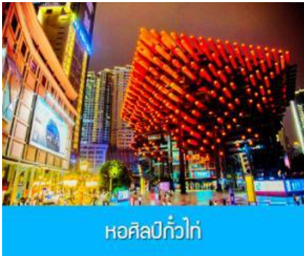
หอศิลป์กั๋วไท่

รับประทานอาหารกลางวัน ณ ร้านอาหารพื้นเมือง (8)