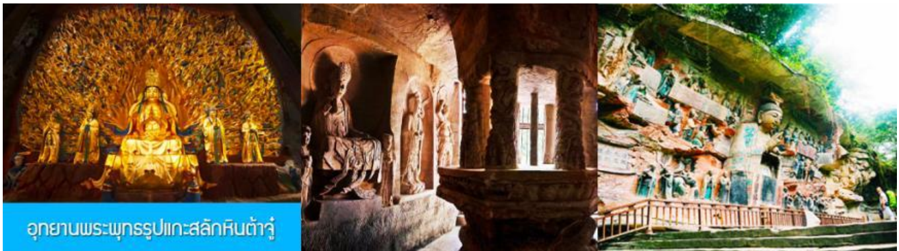
อุทยานพระพุทธรูปแกะสลักหินต้าจู๋