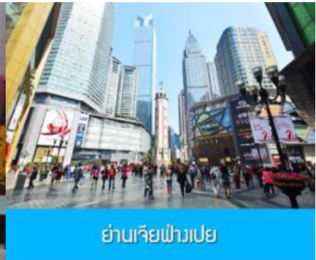
ย่านเจี๋ยฟ่างเปย