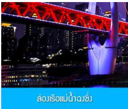
ล่องเรือแม่น้ำจิ่ง

รับประทานอาหารค่ำ ณ ภัตตาคาร (6) (เมนูสุกี้หม่าล่าต้นตำหรับจงชิ่ง)