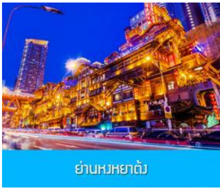
ย่านหงหยาดัว