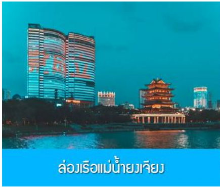
ล่องเรือแม่น้ำยวเจียง