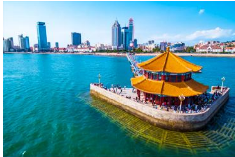
สะพานเคียนเจียว

เช้า รับประทานอาหารเช้า ห้องอาหารของโรงแรม (1)