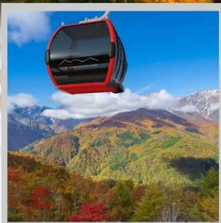
“MT. IWATAKE ROPEWAY”