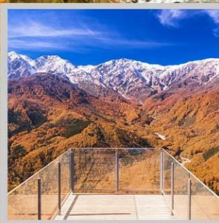
“HAKUBA MT. HARBOR”