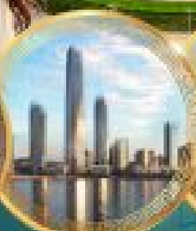
Da Bao Island