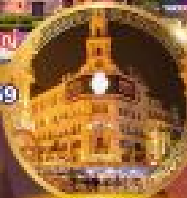
ปราสาทดิสนีย์แลนด์

The Bund ทรานส์มิกซ์ สแควร์แดนซ์ ดิสนีย์คราฟต์สแควร์ดิสนีย์ โอบายูนิคัมป์ ลานแอมฟายน์แดนซ์ Disneytown LEGO Store Shanghai Ocean Aquarium จูราสสิค ปังกนิน โซน Shark Zone ดินแดนไดโนเสาร์