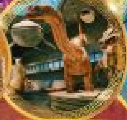
จูราสสิค ปังกนิน โซน