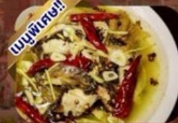
ปลาต้มพริกทอด