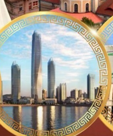
ชมวิวดาคารไช่ตัน เซ็นเตอร์