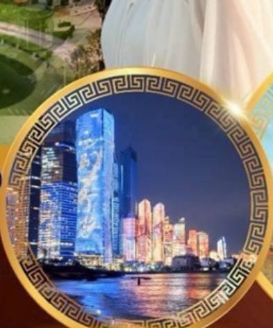
No.3 Bathing Beach

ลานจัดงานเบียร์ชิงเต่า Golden Beach ทางเดินไม้ริมทะเล ศาลเจ้าเทพทะเล ถนนคนเดินโตตง พิพิธภัณฑ์เทศบาลชิงเต่า สวนสาธารณะซิกแนลฮิลล์ ถนนหลงเจียงสู่ กระเช้าภูเขาไท่ผิง ยาน Da Bao Island โบสถ์ st.Michael's Cathedral ถนนจงชาน ถนนคนเดินฟิลาญยวน จัตุรัสเมย์ไฟร์