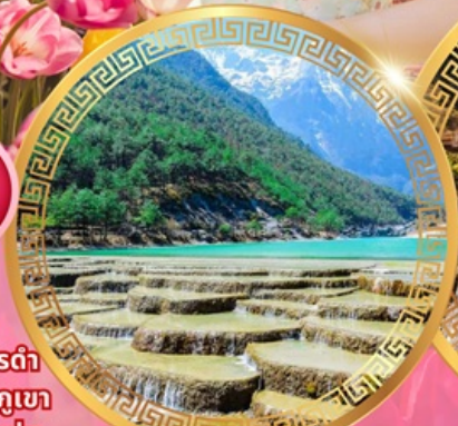
ทะเลสาบไป๋สยเหอ

วัดชงจ้านหลิน ช่องแคบเสือกะโจน สระมังกรดำ เมืองโบราณลีเจียง ภูเขาหิมะมังกรหยก ชมวิวภูเขา หิมะที่ร้าน Yun di ta ชมดอกไม้ที่สวนอุทยานชุ่ม น้ำโกวหนาน ชมดอกซากุระสวนหยวนทง