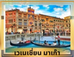
เวเนเซียน มาเก๊า