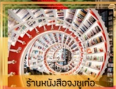
ร้านหนังสือจตุเก๋