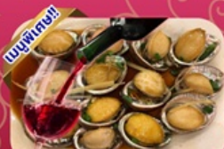
ซีฟู้ด เป้าฮ้อ+ไวน์แดง