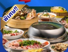
พูฟฟีซ่าบู