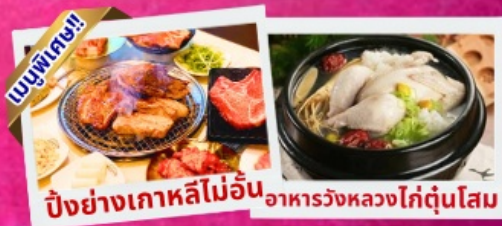
บริการอาหารพรีเมียมทุกมื้อ

ชมศิลปะดิจิทัลสุดล้ำ บนจอ LED เสมือนจริงขนาดยักษ์ อิสระช้อปปีงย่านดัง คังนัม เมียงดง ฮงแด ซองซู ช้อปปลอดภาษี Lotte Duty Free