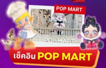
เช็คอิน POP MART