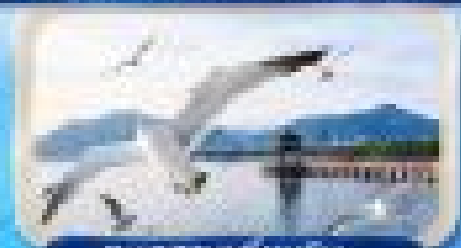
ทะเลสาบอู๋ยเจ้อ