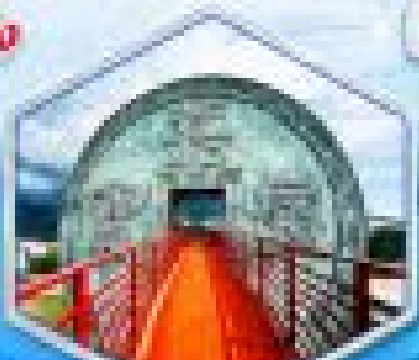
ประตูเมืองคุนหมิง