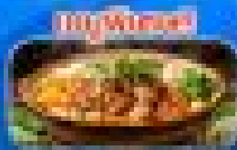
สุกี้ไก่