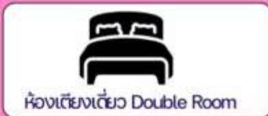
ห้องเตียงเดี่ยว Double Room