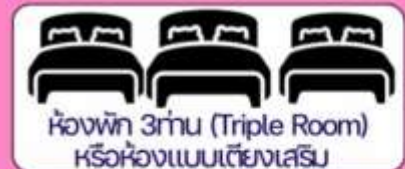
ห้องพัก 3 ท่าน (Triple Room) หรือห้องแบบเตียงเสริม

กรณีพัก 3 ท่านถ้าวันที่เข้าพักโรงแรม ไม่มีห้อง TRP (3 ท่าน) อาจจำเป็นต้องแยกพัก 2 ห้อง (มีค่าใช้จ่ายพักเดี่ยวเพิ่ม) กรณีห้อง TWIN BED (เตียงเดี่ยว 2 เตียง) ซึ่งโรงแรมไม่มีหรือเต็ม ทางบริษัทขอปรับเป็นห้อง DOUBLE BED แทนโดยมีต้องแจ้งให้ทราบล่วงหน้า หรือ หากต้องการห้องพักแบบ DOUBLE BED (1 เตียงใหญ่) ซึ่งโรงแรมไม่มีหรือเต็ม ทางบริษัทขอปรับเป็นห้อง TWIN BED แทนโดยมีต้องแจ้งให้ทราบล่วงหน้า กรณีห้องพักในเมืองที่ระบุไว้ในโปรแกรมมีเทศกาลวันหยุดยาว มีงานประชุมหรืองานแฟร์ต่างๆ บริษัทขอจัดที่พักในเมืองใกล้เคียงแทน