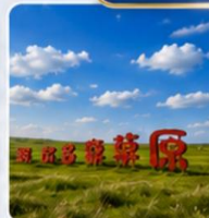
ทุ่งหญ้าออร์ดอส พิพิธภัณฑ์แบบชาวมองโกเลีย สวนซุดมองโกเลีย ป่าที่ร้อนกึ่งไฟ