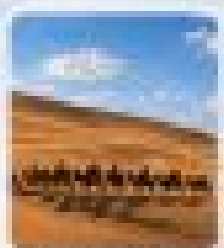
คาราวานออร์ดอส (รถคาราวาน)