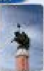
เมืองออร์ดอส (เมืองโกลีเสียน)