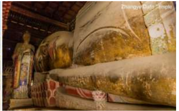
Zhangye Dafa Temple

จากนั้นนำท่านสู่ อุทยานธรณีแห่งชาติจางเย่ (Zhangye National Geopark) ซึ่งเป็นที่ตั้งของ "ภูเขาสายรุ้ง" หรือแนวเขาที่มีลวดลายสีสลับแปลกตาตามธรรมชาติ นำท่านเข้าชม ภูเขาสายรุ้งจางเย่ต้นเซีย่ (Zhangye Danxia Landform): จุดเช็คอินยอดนิยมที่มีภูเขาหินทรายหลากสีสลับเป็นริ้วสวยงาม จนได้รับการขนานนามว่าเป็น "ภูเขาสายรุ้งแห่งแดนเหนือ" นำท่านชม ภูเขาสายรุ้งจางเย่ต้นเซีย่ (Zhangye Danxia Landform) (รวมรถในอุทยาน) จุดเช็คอินยอดนิยมที่มีภูเขาหินทรายหลากสีสลับเป็นริ้วสวยงาม จนได้รับการขนานนามว่าเป็น "ภูเขาสายรุ้งแห่งแดนเหนือ" ตั้งอยู่ในมณฑลกานซู่ ประเทศจีน เป็นอุทยานธรณีแห่งชาติที่ขึ้นชื่อเรื่องแนวเขาหินทรายและแร่ธาตุสีสลับสดใสคล้ายสายรุ้ง เกิดจากการทับถมและเคลื่อนตัวของเปลือกโลกนานกว่า 24 ล้านปี สวยงามระดับมรดกโลก UNESCO เป็นแนวเขาสีแดง ส้ม เหลือง ขาว และน้ำตาล สลับกัน เกิดจากตะกอนหินทรายและแร่ธาตุต่างๆ ทับถมกันนานกว่า 24 ล้านปี และถูกยกตัวขึ้นจากการเคลื่อนที่ของเปลือกโลก (คล้ายกับการเคลื่อนตัวของเทือกเขาแอนดีส) ซึ่งมีจุดชมวิวหลายจุด (Scenic Spots) ซึ่งสามารถมองเห็นภูเขาสีรุ้งได้กว้างขวาง โดยเฉพาะจุดชมวิวที่มีสีสลับชัดเจนที่สุด