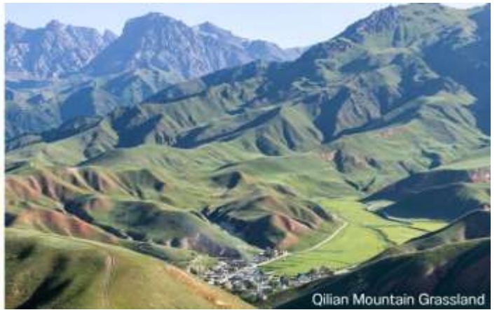
Qilian Mountain Grassland