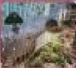
ชมธรรมชาติและสวน