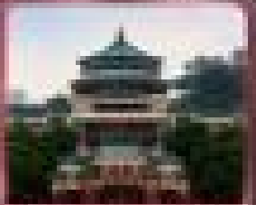
ชมวัดโบราณและสวน