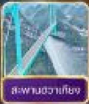
สะพานหวัดหนานก๊วย Shuangnan Guanyou