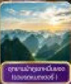
อุทยานป่าภูเขามหัศจรรย์ Lanang Hangshang