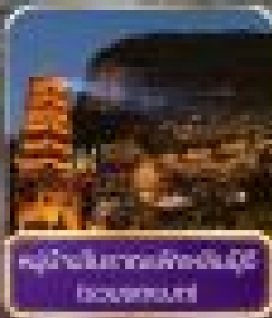
ล่องเรือในลานานาฮังชัง Lanang Hangshang