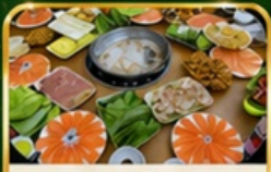
ชาปูแชลมอน