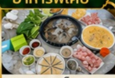
ชาปูเห็ด