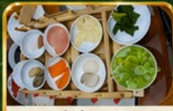
ซุนมินจันซำสะพาน