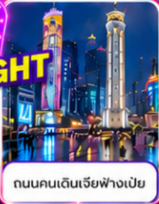
ถนนคนเดินเจียฟางเปี่ย