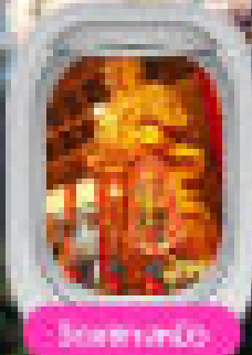
Beef with chili