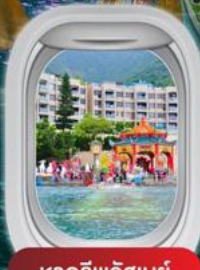
หาดริฟลิสเบย์