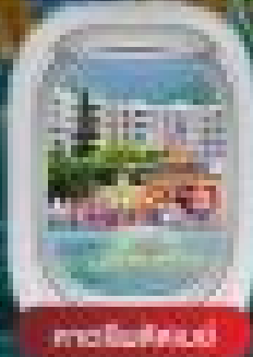
เมืองฮ่องกง