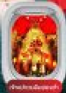
อาหารฮ่องกง