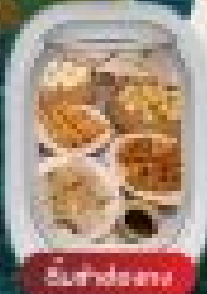
อาหารฮ่องกง