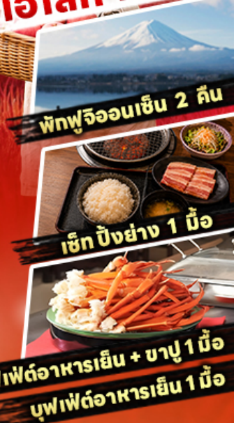
พิทฟูจิออนเซ็น 2 ถิ่น