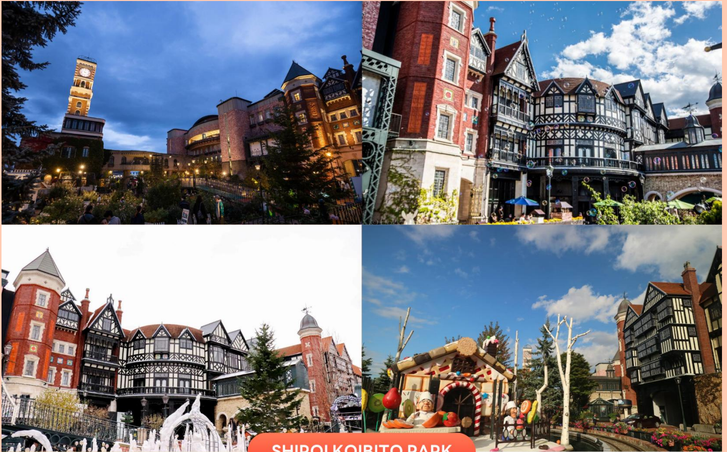
SHIROI KOBITO PARK