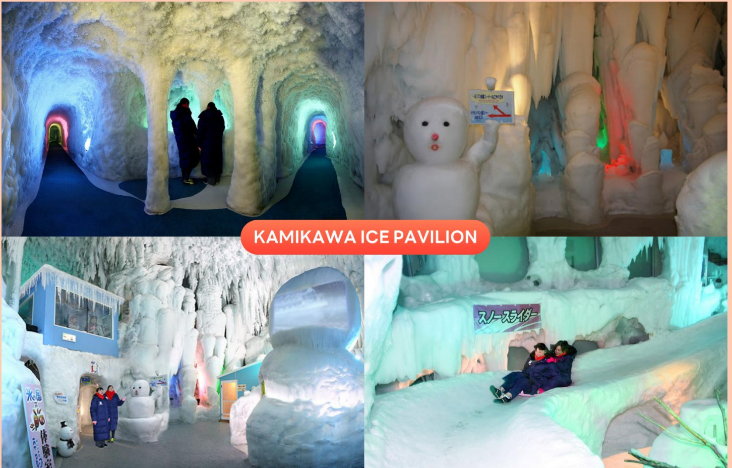
KAMIKAWA ICE PAVILION

จากนั้นนำท่านเดินทางสู่ เมืองคามิดาวะ (Kamikawa) เป็นเมืองที่ตั้งอยู่ในจังหวัดฮอกไกโด โดดเด่นด้วยธรรมชาติอัน อุดมสมบูรณ์ โดยเป็นประตูสู่อุทยานแห่งชาติไดเซตสึซัง เพื่อนำท่านสัมผัสประสบการณ์ความหนาวสุดขั้วที่ พิพิธภัณฑ์ หิมะและน้ำแข็งคามิดาวะ (Kamikawa Ice Pavilion) ดินแดนแห่งโลกน้ำแข็งที่เปิดให้เข้าชมได้ตลอดทั้งปี ภายในจัด แสดงอุโมงค์น้ำแข็ง และเสาน้ำแข็งขนาดใหญ่ที่ถูกเก็บรักษาไว้ในอุณหภูมิต่ำประมาณ -20 องศาเซลเซียส สร้างบรรยากาศ ราวกับหลุดเข้าไปอยู่ในอาณาจักรน้ำแข็งสุดมหัศจรรย์ พร้อมชมปรากฏการณ์ “Diamond Dust” เกิดน้ำแข็งระยิบระยับ ที่ส่องประกายงดงาม และทดลองสัมผัสอุณหภูมิต่ำสุดที่เคยบันทึกได้ใน ประเทศญี่ปุ่น อีกทั้งยังมีกิจกรรมสุดพิเศษ เช่น การทดลองผ้าขนหนูแข็งตัวในฟรีบตา และมุมถ่ายภาพสวยงามมากมาย ให้ทุกท่านได้เก็บภาพความประทับใจท่ามกลางโลกแห่งความเย็นเยือกที่หาได้ยากจากที่อื่น