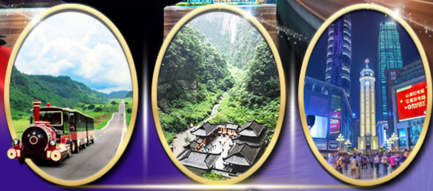
อุทยานเขานางฟ้า อุทยานหลุมฟ้า สะพานสวรรค์ ถนนคนเดินเจียฟางเป็ย

รหัสทัวร์ RJ-CZCKG01 เดินทาง 5D 3N ท.ค. - ต.ค. 2569