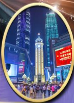
ถนนคนเดินเจี๋ยฟางเป่ย์