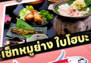
เช็กเมนูย่าง ใบโอบะ