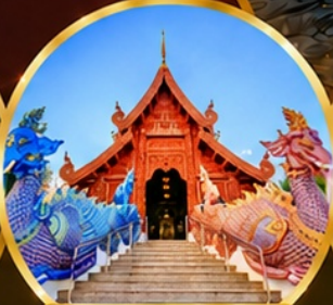
วัดเด่นสะหลีศรีเมืองแกน