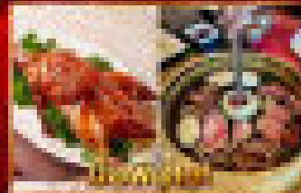
ภัตตาคาร (อาหารจีน)