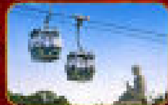
ลิฟท์ขึ้นเขา