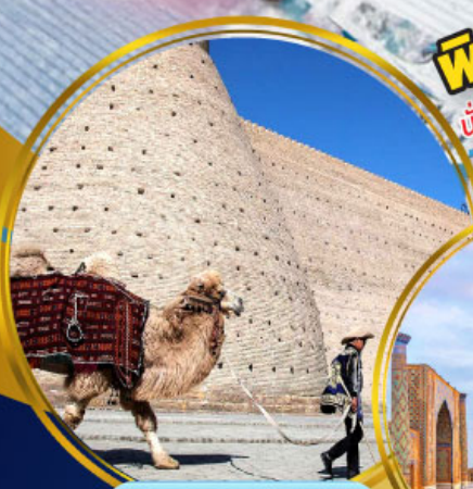
บ้อมปราทารบุคาร่า