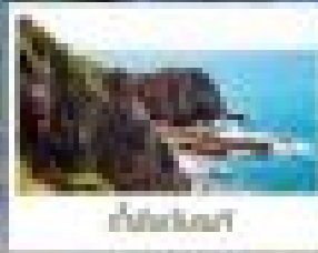
เมืองวากายามะ