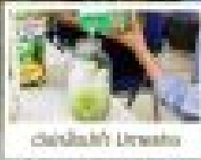
เมืองวากายามะ