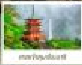
เมืองโอซากะ