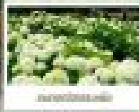
พญานางพญา