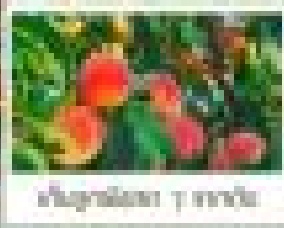
พญานางพญา 7 สายพันธุ์