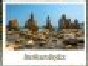
เมืองโอซากะ