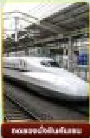
รถความเร็วสูงชินคันเซน