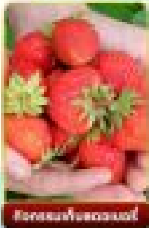
ฟรีผลไม้สดตลอด