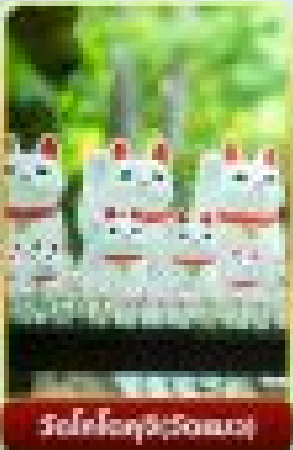
วัดโองโองคุชิ(วัดแมว)