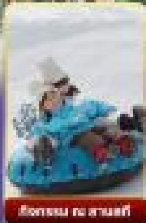
กิจกรรม ไร่ สานนท์