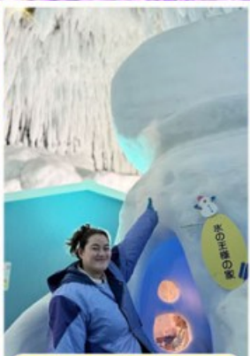
พิพิธภัณฑ์น้ำแข็ง