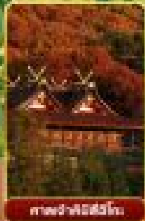
น้ำตกคางาวะที่โอบะ