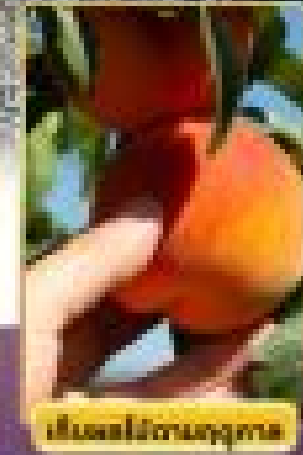
เป็นผลไม้ตามฤดูกาล