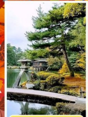
สวนเคนโระคุเอ็น