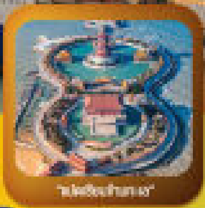
"โอบอลันฮิงเต่า"

ชมพิพิธภัณฑ์หุ่นขี้ผึ้ง - พิพิธภัณฑ์ - พิพิธภัณฑ์ สวนสัตว์โลก พิพิธภัณฑ์ - พิพิธภัณฑ์ สวนสัตว์โลก - พิพิธภัณฑ์ - พิพิธภัณฑ์ สวนสัตว์โลก พิพิธภัณฑ์ - พิพิธภัณฑ์ สวนสัตว์โลก - พิพิธภัณฑ์ - พิพิธภัณฑ์ สวนสัตว์โลก พิพิธภัณฑ์ - พิพิธภัณฑ์ สวนสัตว์โลก - พิพิธภัณฑ์ - พิพิธภัณฑ์ สวนสัตว์โลก