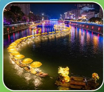
"ล่องเรือมังกรกังสุ่ย"

เที่ยวจีน 2 มณฑล เสฉวน+หูเป่ย์ (เมืองฉงชิ่ง+เมืองเอ็นฉีอ) • ต้าเถิงหลง ล่องเรือมังกรกังสุ่ยชมวิวยามค่ำคืน • ผิงซานแกรนด์แคนยอน (รวมล่องเรือ) หงหยาดัง • วัดหลัวอัน • ถนนคนเดินเจียฟางเป่ย์ • ตึกตะเกียบ